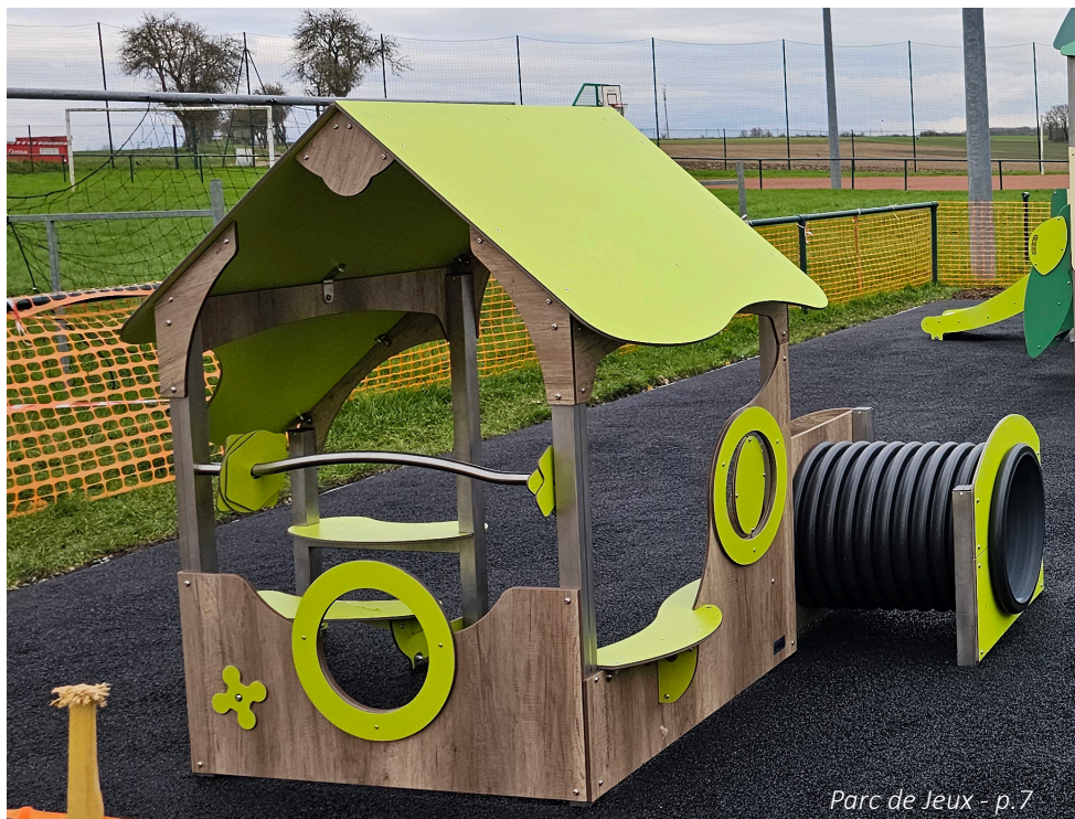
Parc de Jeux - p. 7